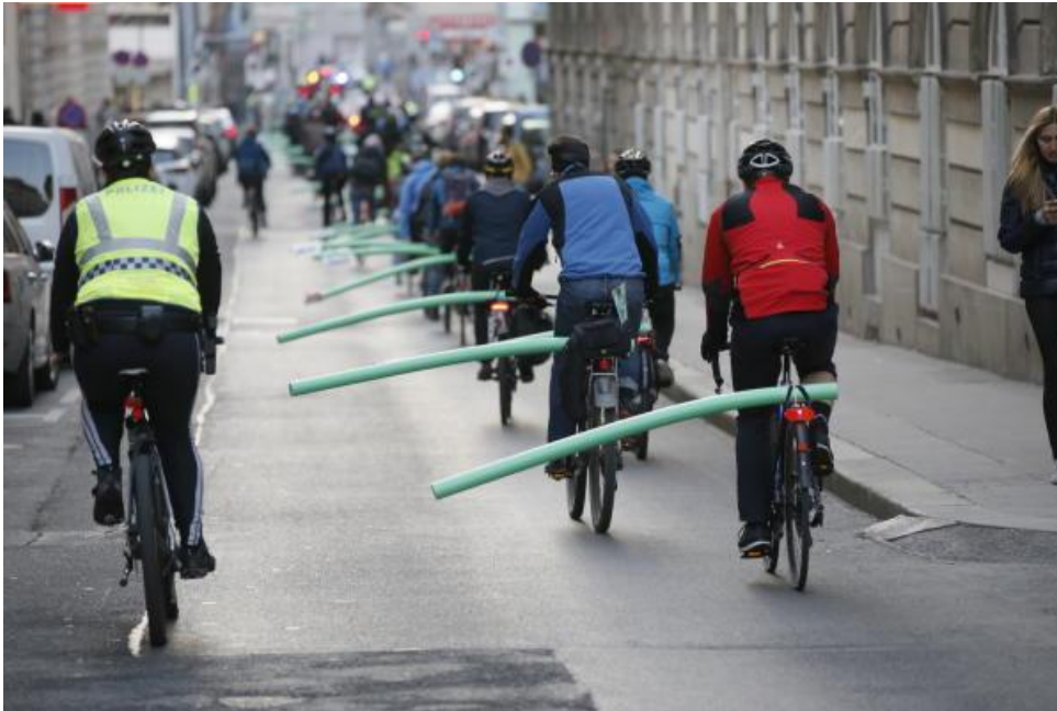
Bild: Badenudel-Aktion in Wien im Oktober 2018