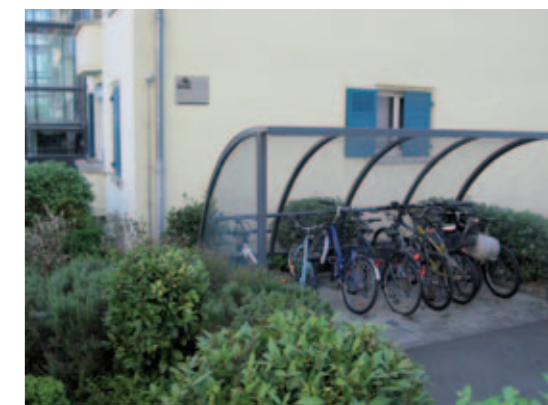
Parking vélo couvert à Lausanne

extérieures couvertes à la rue de la Borde à Lausanne, 30 places sécurisées au centre commercial d'Ecublens, 20 places supplémentaires pour le projet «En Belle Vue» à Renens, 52 places dans un complexe administratif à Tolochenaz ou encore, cerise sur le gâteau, 15 places couvertes au Mc Donald's de Crissier.