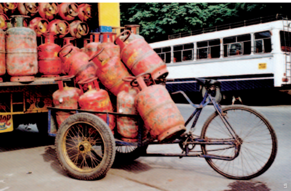
En Inde, ce n'est pas le camion qui répartit les bonbonnes de gaz dans la ville de Bombay, mais un triporteur. Le camion s'arrête aux portes de la ville.

Il faudra lui dédier une place et que cela soit clair pour tous les usagers de la route. Avec l'apparition d'un nouveau type d'usager, les autres usagers des rues et des routes doivent s'adapter. Oui un triporteur ralentit la vitesse sur les pistes cyclables, mais qu'est-ce que une ou deux minutes de «perdus» face au bénéfice de réduire durablement les nuisances dues