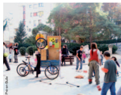
Le triporteur cirque de la maison de quartier Pré-en-Bulle, Genève