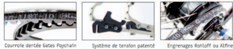
Courroie dentée Gates Poychain