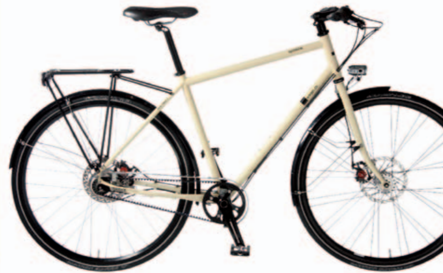
Modèle: simpel.ch optimist Rohloff

Infos, conseils, réflexions, récits: bienvenue à la rubrique Voyages qui souhaite aborder différents thèmes ayant trait au voyage à vélo et s'étoffer au gré de vos suggestions.