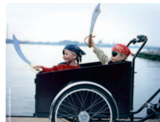
Triporteur danois Christiania pour le transport d'enfants

Selon l'article de wikipedia consacré aux triporteurs, on distingue les modèles européen et asiatique. Le modèle européen est composé, à l'avant, d'une caisse reposant sur deux roues placées de chaque côté. Pour le diriger, le conducteur fait pivoter la caisse autour d'un axe central qui la relie au cadre maintenant la roue arrière. Le modèle asiatique (chinois) a deux roues à l'arrière, qui portent la charge, et un essieu à différentiel entraîné par la chaîne. Le conducteur le dirige par le guidon de la roue avant comme un vélo classique.