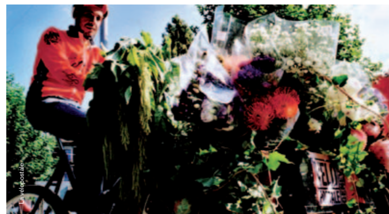
Transport de fleurs en triporteur

L'automobiliste se pose rarement la question de l'utilité de ses trois ou quatre sièges supplémentaires, quand il se retrouve seul après avoir déposé ses enfants à l'école. Dans certaines contrées, on amène plus naturellement quelques bambins en triporteur jusqu'au préau, et on se sent moins ridicule d'arriver ensuite au travail avec un véhicule surdimensionné pour la seule maman ou le seul papa. C'est le cas à Copenhague, où le tricycle est plus répandu. Question de point de vue.