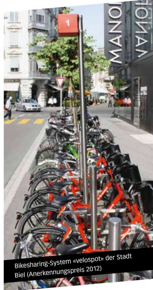
Bikesharing-System «velospot» der Stadt Biel (Anerkennungspreis 2012)

Pro Velo Schweiz prüft die eingegangenen Bewerbungen hinsichtlich Erfüllung der Teilnahmevoraussetzungen und behält sich vor, allenfalls weitere Informationen und Bildmaterial einzuholen.