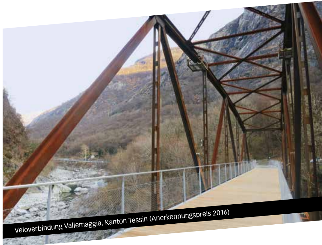
Veloverbindung Vallemaggia, Kanton Tessin (Anerkennungspreis 2016)

Der «PRIX VELO Infrastruktur» wird unterstützt vom Bundesamt für Strassen (ASTRA), velosuisse und Velopa. Medienpartner sind die «Schweizer Gemeinde» und das velojournal.