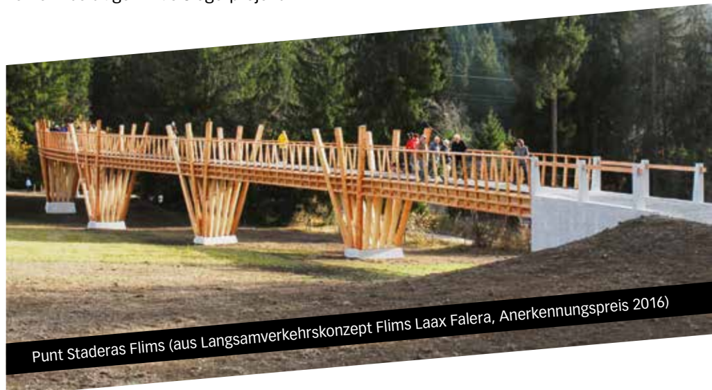
Punt Staderas Flims (aus Langsamverkehrskonzept Flims Laax Falera, Anerkennungspreis 2016)

wird mit einer Preissumme von CHF 10000.–, weitere Wettbewerbseingaben mit einem Anerkennungspreis ausgezeichnet. Die Preisträger werden im Rahmen eines Anlasses prämiert und national kommuniziert.