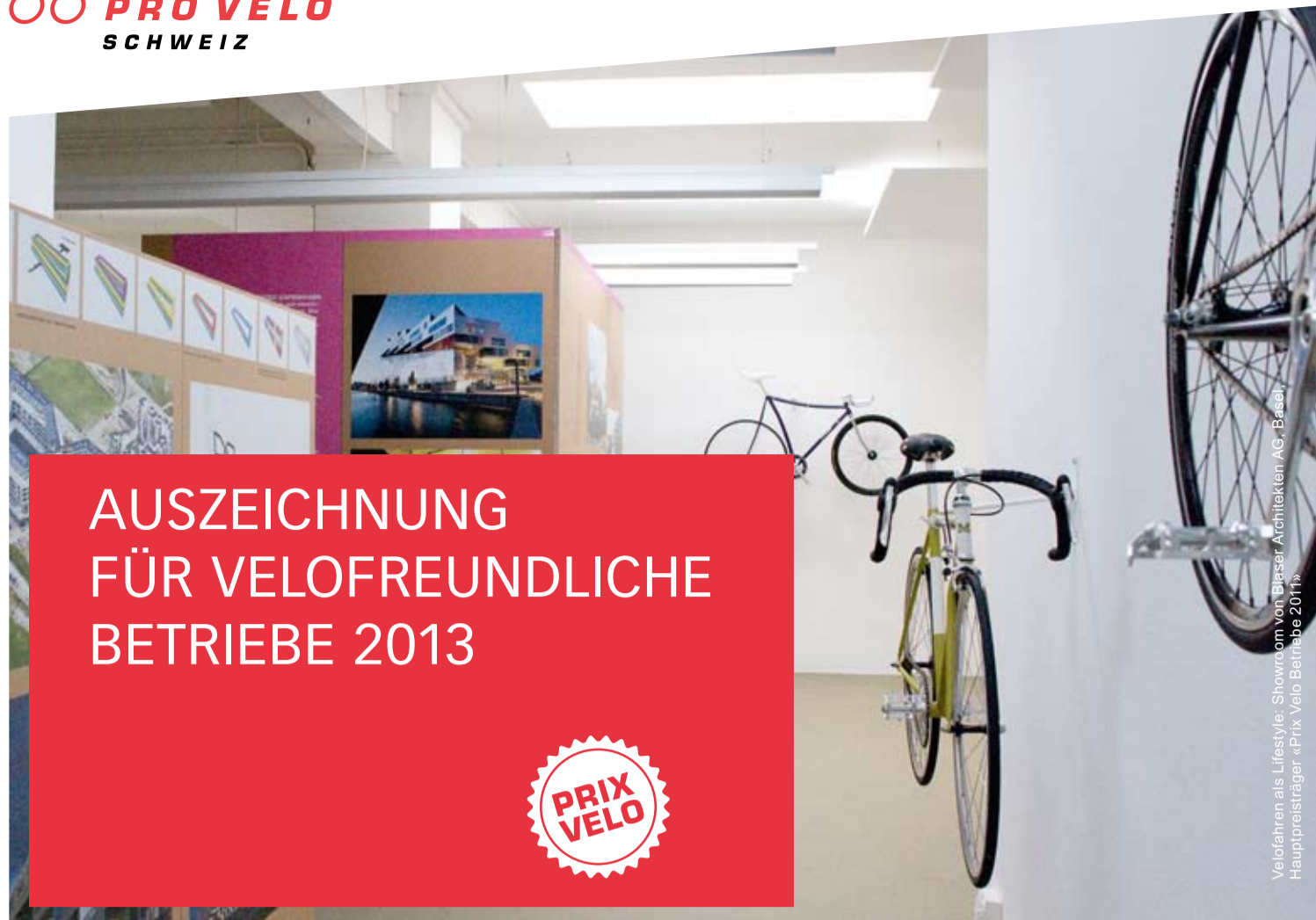
Velofahren als Lifestyle - Showroom von Bärler Architekten AG, Basel, Hauptpreisträger «Prix Velo Betriebe 2011»