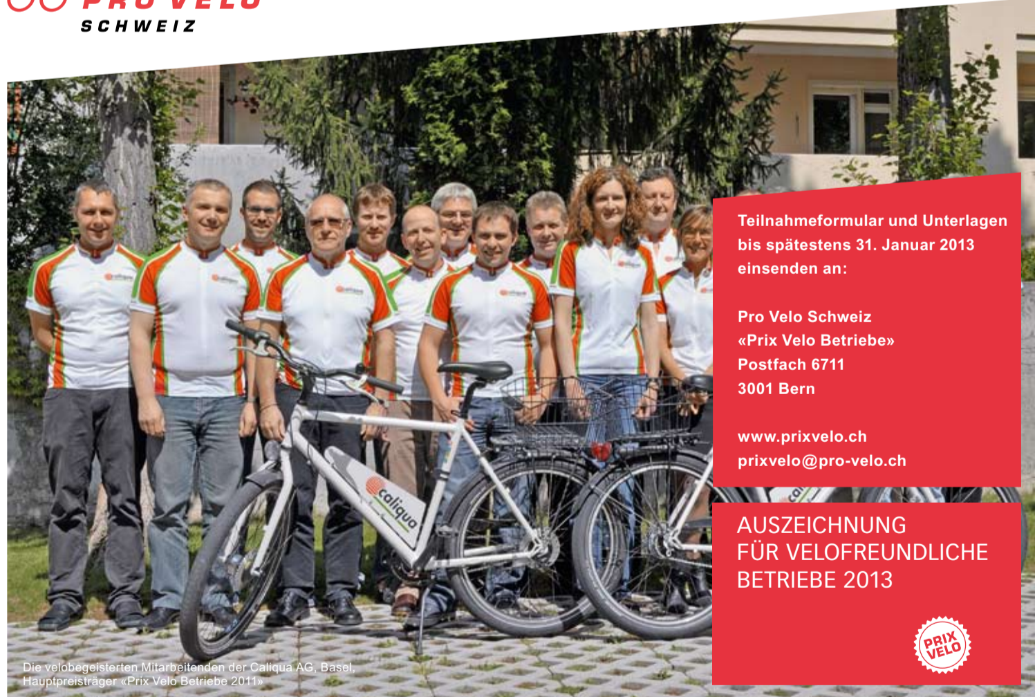
Die velobegleitetsten Mitarbeitenden der Calliqua AG, Basel, Hauptpreisträger «Prix Velo Betriebe 2011»

Alle Preisträger werden auf der Website www.prixvelo.ch und im Rahmen eines Events mit Medienpräsenz erwähnt.