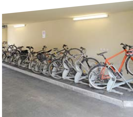
Veloabstellanlage der Caliqua AG, Basel, Hauptpreisträger «Prix Velo Betriebe 2011»

Partner des «Prix Velo Betriebe» sind das Bundesamt für Umwelt (BAFU), Biketec, velosuisse und velopa. Medienpartner ist «KMU-Magazin».