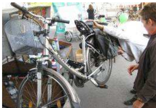
Atelier de réparation vélo