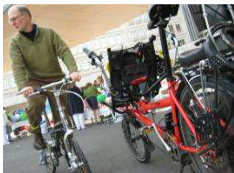
Stands d'essai de vélos pliants