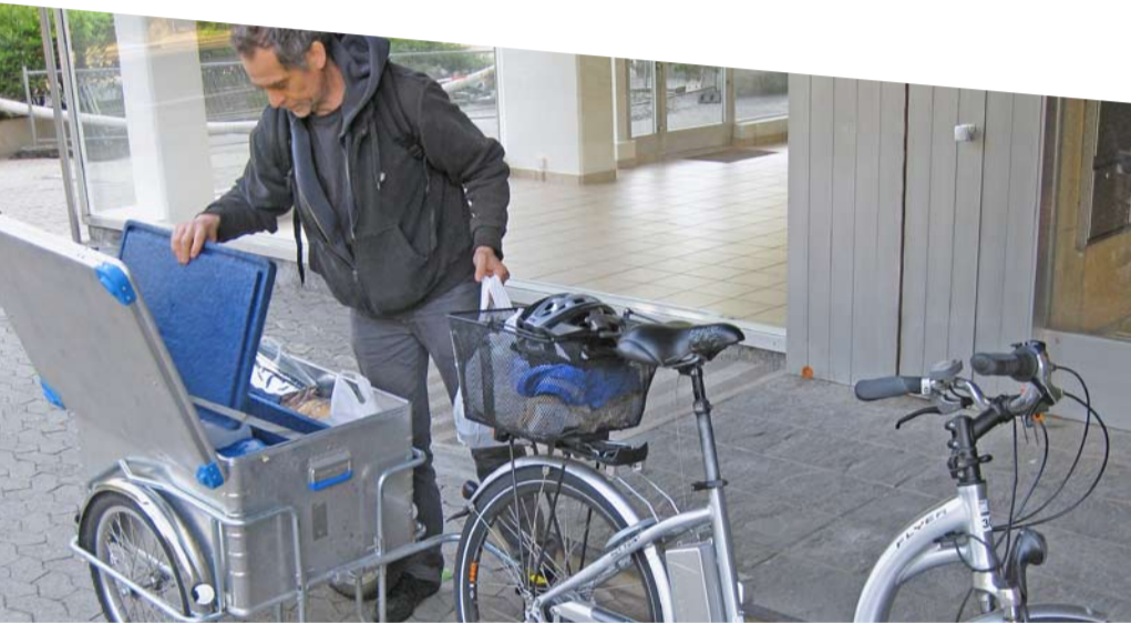
Einsatzfahrzeug von FSASD (Spitex) Carouge, Hauptpreisträger «Prix Velo Betriebe» 2009

Pro Velo Schweiz behält sich vor, Bewerbungen vor Ort zu besichtigen und allfällige weitere Informationen einzuholen.