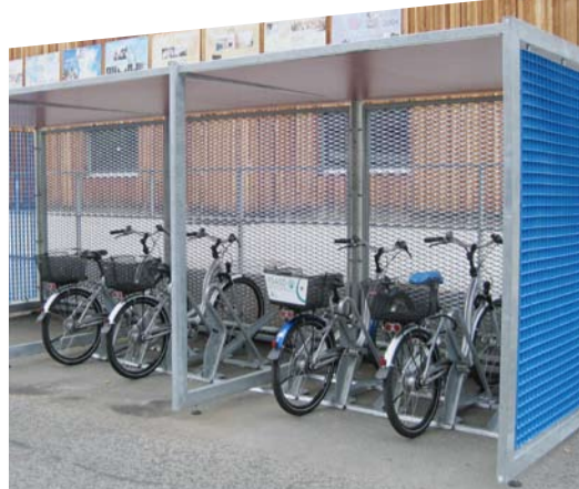
Veloabstellanlage FSASD (Spitex) Carouge, Hauptpreisträger «Prix Velo Betriebe» 2009

Aéroport International de Genève / AUE Kanton Basel-Stadt / Bank Sarasin Basel / Bundesamt für Sport Magglingen / Clariant Produkte (Schweiz) AG, Muttenz / Eawag Dübendorf / Ernst Basler+Partner AG Zürich / Felix-Platter-Spital Basel / FSASD Carouge / Gemeinde Kriens / Kantonsspital Aarau / Kantonsspital Baden AG / Kantonsspital Luzern / Kantonsspital Schaffhausen / INFICON AG Balzers / Novartis Services AG Basel / PAX Versicherungen Basel / Psychiatrische Dienste Thurgau / Spital Thun-Simmmental / Spitex Basel / Unaxis Balzers / Ville de Genève / veloplus AG Wetzikon