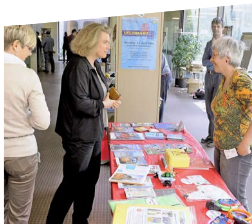
Veloinfostand der Clariant Produkte (Schweiz) AG, Muttenz, Hauptpreisträger «Prix Velo Betriebe» 2009