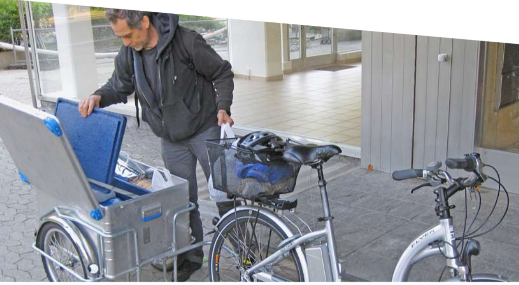
Livraison de repas par la FSASD à Carouge, gagnant «Prix Vélo entreprises» 2009

PRO VELO Suisse se réserve le droit d'effectuer des visites sur place et de se procurer des renseignements supplémentaires.