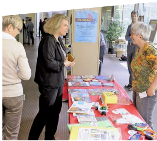
Stand d'information de Clariant Produits (Suisse) SA, Muttenz, gagnant «Prix Vélo entreprises» 2009