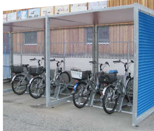
Stationnement vélo de la FSASD à Carouge, gagnant «Prix Vélo entreprises» 2009

Aéroport International de Genève / AUE canton de Bâle-Ville / Banque Sarasin, Bâle / Office fédéral des sports, Macolin / Clariant Produits (Suisse) SA, Muttenz / Eawag, Dübendorf / Ernst Basler + Partner AG, Zurich / Hôpital Felix-Platter, Bâle / FSASD, Carouge / Commune de Kriens / Hôpital cantonal d'Aarau / Hôpital cantonal de Baden AG / Hôpital cantonal de Lucerne / Hôpital cantonal de Schaffhouse / INFICON AG, Balzers / Novartis Services AG, Bâle / PAX Assurances, Bâle / Services psychiatriques de Thurgovie / Hôpital Thoune-Simmental / Spitex Bâle / Unaxis, Balzers / Ville de Genève / Veloplus AG, Wetzikon